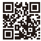
公司網站 FB 網站