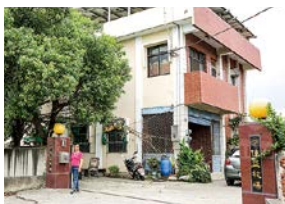
彰化縣和美鎮和健路180巷50弄1號 facebook 彰農羊乳中區太平洋經銷 06-6534656

為了使羊奶更易被人接受，彰農羊乳經多次製程改良，加工手法講究低溫環境，新鮮榨得的羊乳必須在116°C的高溫下，快速殺菌3秒，接著送入冷水系統，極速將溫度降至5°C冷充填。如此嚴格控管的新鮮度，使彰農羊乳飲來更加溫醇甜香，逐漸在彰化及大台中地區打響名號。